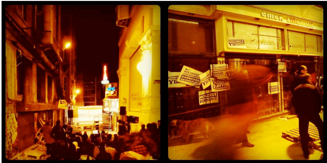
Eylemciler Emek Sineması ve Demirören AVM arasında yer alan sokakta film gösteriminde

binası Sosyal Güvenlik Kurumu'na, yani kamuya, yani bizlere aittir ve şüphesiz ki bu alan üzerindeki her türlü kullanım hakkı kamunundur ve kolektiftir. Nazarımızda meşru ve esas olan Beyoğlu Belediye Başkanı, Kültür ve Turizm Bakanı, Yenileme Kurulu Üyeleri ve Kamer İnşaat gibi şirketlerin çıkarları değil, kamunun yararı ve kararidir. Ticarileştirilen sanatsal ve kültürel üretime, özelleştirilen kamusal alanlara karşı kamusal müştereklere sahip çıkmanın gerekliliğine inanıyoruz. Bu nedenle, alenen ilan ediyoruz, iktidarın keyfi hukuksuzluğuna karşı Emek Sineması'nı geri alıyoruz!" 24