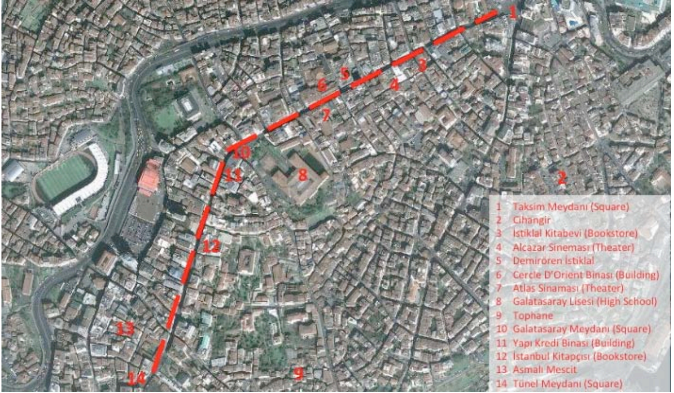
İstiklal Caddesi ve yazıda bahsi geçen mekânlar