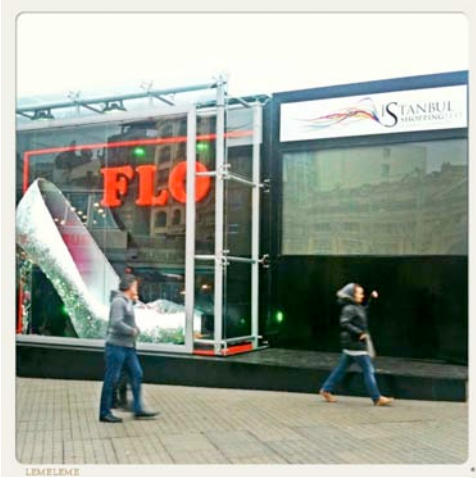
İstanbul Shopping Fest kapsamında İstiklal Caddesi markalar tarafından kuşatıldı.

AVM'lerin ve büyük markaların promosyonunun yapıldığı bu tüketim etkinliği, İstanbul'un Abdi İpekçi, Bağdat ve İstiklal gibi belli başlı anacaddelerinde de düzenlendi. İstiklal Caddesi'ni "Türkiye'nin En Eklektik Caddesi" sloganı ile pazarlarken sanki genel olarak yukarıda bahsedilen kentsel dönüşüm ve AVM'leşme süreci, özel olarak da yapılan bu tarzda tüketim etkinlikleri sonucunda caddenin "eklektik" özelliğinin hızla yitirmesi, dünyanın herhangi bir küresel kentinin anacaddesi ile aynışması, ve bunun sadece piyasa yolu bir soylulaştırma süreci ile değil aynı zamanda kamunun politikaları ile yönlendirilmesi meselelerinin üstünü örtmeye çalışıyordu.