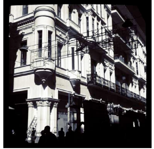
Solda MANGO'ya satılan eski İstanbul Kitapçısı, sağda da yeni açılan Demirören İstiklal AVM

Cadde üzerinde yerli ve yabancı sermayenin baş döndürücü hızdaki emlak yatırımlarına paralel bir şekilde, büyük bankaların (Garanti, Akbank, Yapı Kredi) ve holdinglerin (Sabancı, Koç, Borusan) sponsorluğunda kurumsal sanat merkezleri ve büyük markaların (Lacoste, Nike, Converse, Mango) prestij mağazaları açılmakta. Ayrıca Cadde tarihinde ilk defa alışveriş merkezleri (AVM) cazip emlak yatırımları olarak öne çıkmakta. 12 Bu örnekler, sermayenin gözünde mekânın kendisinin birikim süreçlerinde merkezi bir yer teşkil ettiğine ve iç içe geçen kentsel dönüşüm ve kültür politikalarına işaret etmekte. İstiklal ve çevresinde görülen emlak hareketliliği ve mekânsal dönüşüm, İstanbul'un 2000 sonrası gelişen Avrupa'nın en "cool" şehri imajı ve bu imajı destekleyen 2010 Avrupa Kültür Başkenti statüsü gibi "marka kent" söylemleri çerçevesinde düşünülebilir. Aşağıda, İstiklal Caddesi'nin hemen altında yer alan, cadde tarihine paralel bir şekilde dönüşen, "İstanbul'un kozmopolit merkezlerinden biriyken zamanla yoksullaşıp şiddet ve uyuşturucu ile özdeşleşen, daha sonra aldığı göçlerle muhafazakârlaşan" 13 ve şimdi de sermaye baskısıyla soylulaştırılan Tophane'nin merkezindeki eski bir binanın satılık ilanını görebilirsiniz. İlanı veren emlak şirketi, bu binaya hem yerli (satılık) hem de yabancı ( for sale ) müşteri aramakta.