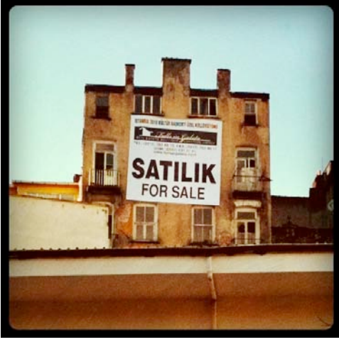
Tophane for Sale (2010)

Caddede yer alan özel mekânlar yatırım ve rant amaçlı uluslararası yatırımcıların portfolyolarında hızla yer alırken, caddenin kendisi ve cadde boyunca yer alan kamusal mekânlar da (meydanlar, sokaklar, gökyüzü, bina cepheleri vs.) ulusal ve uluslararası markaların pazarlanması için geçici olarak özelleştirilmekte. Bu geçicilik, sermayenin zaman ve mekân tanımazlığı ile süreklilik ve kalıcılık kazanmakta. Yılbaşı aydınlatması olarak ortaya çıkan ama artık bütün sene boyunca kaldırılmayan kilometrelerce uzanan reklam içerikli ışıklı süslemeler; Taksim, Galatasaray ve Tünel Meydanları'nda köşe kapmaca oynayan, farklı markaları tanıtan devasa ürün maketleri; yine bu meydanları ışıklatan gerilla-art olarak ortaya çıkan ama reklam sektörü tarafından evcilleştirilen bina yüzeylerine projeksiyonlar caddenin değişmez dekorları olarak yerlerini almakta. Kamusal mekânda kent heykellerinin yanında konumlandırılan reklam enstalasyonları kamusal/özel, sanat/reklam, izleyici/tüketici ayrımlarını silikleştirerek sadece mekânın fonksiyonlarını değil mekânın kendisini de ticarileştirmekte.