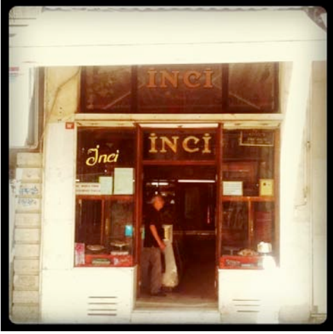
İnci Pastanesi zorla tahliyeye direniyor

Diğer taraftan bu yapının komşusu olan, aslen Sosyal Güvenlik Kurumu'na, yani kamuya ait Cercle D'Orient binası (ve içindeki Emek Sineması) yerel belediye, Kültür ve Turizm Bakanlığı, Yenileme Kurulu gibi kamu aktörlerinden hiçbir destek görememekte. Aksine, bu kamu aktörleri yapı adasını özelleştirmek, içindeki işletmeleri zorla tahliye etmek, burayı yıkıp, yerine "tarihi görünümlü" bir kaplama cephe ve yeni bir AVM inşa etme niyetinde. Aşağı yukarı bütün işletmeler, ki buna Emek Sineması da dahil, kepenklerini indirmiş durumda.