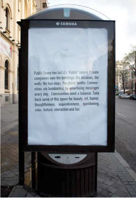
Kamusal mekân kamusallığını kaybetti

“Kamusal mekân kamusallığını kaybetti. Özel şirketler binalara, pencerelere, duvarlara, otobüs duraklarına, telefon kabinlerine sahipler. Topluluklar her gün reklam mesajları bombardımanına maruz bırakılıyorlar. Toplulukların bir dengelemeye ihtiyaçları var. Bu mekânların bir kısmını güzellik, sanat, mizah, düşüncelilik, meraklılık, sorgulama, renk, doku, etkileşim ve eğlence için geri alın!” 21