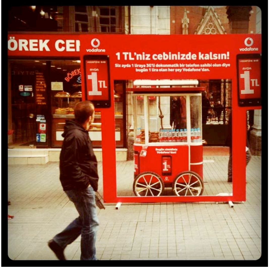
İstiklal Caddesi'nin simitçileri Vodafone reklam stantlarına dönüşmüş

kentsel tasarım ve estetik, hem de kamusal alanların kapanması, tektipleştirilmesi, özelleştirilmesi ve ticarileştirilmesi açısından bir "kent sorunu" olarak tanımlanabilir.