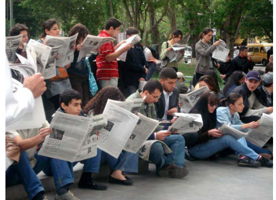
Hima - "Gazete okuma" - 1 Mart Olayları'nın ardından kamusal alanda bütün eylemler yasaklandıktan sonra yapılan ilk eylemlerden biri.