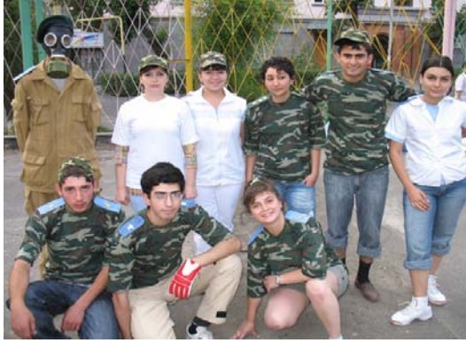
Hima – Futbol – 03.07.2008