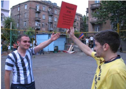
Hima – Futbol – 03.07.2008

2007 sonbaharında, ülkenin ilk başkanı Levon Ter-Petrosyan, 19 Şubat 2008 başkanlık seçimlerine katılmak için siyasi faaliyetine geri döndü. Tam da, bunun gibi yeni siyasi özneleri dayanak yapma niyetindeydi. Bu durum, bilhassa şehrin merkezi yerlerinde çeşitli eylemler gerçekleştiren genç inisiyatiflerin faaliyetlerine güç verdi. Burada özellikle Hima (Şimdi) 7 ve Hatuk Gund (Özel Tabur) 8 adlı gençlik inisiyatiflerinden, Ver Katz (Kalk Ayağa) 9 siyasi hareketinden, Mi Khump Usanoghner (Bir Grup Öğrenci) gençlik hareketinden, Yeritasard Pahpanoghakanner (Genç Tutucular) STK'sından ve Art Laboratoria (Sanat Laboratuvarı) kültürel organizasyonundan bahsetmekte yarar var.