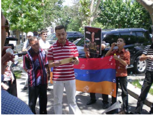
Hatuk Gund – Savcının Ofisinin Önünde Balonlar - 2008

Hareketin ilk aşaması, yönetimin barışçıl göstericilere karşı silah kullanarak, en az 10 kişiyi öldürmesi sonucu yaşanan 1 Mart'taki kanlı faciayla son buldu. Ülkede gösteriler, toplantılar, ifade özgürlüğü ve diğer hak ve özgürlükler sınırlandı. Yüzlerce aktivist kendini hapiste buldu. Yönetim, olağanüstü hâlin resmen sona ermesinden sonra da toplantı, gösteri ve yürüyüşlere izin vermemektedir. Lakin, aktivist gruplar, polislin kendilerine karşı kanunsuz gücün tüm şekillerini kullanması karşısında faaliyetlerini daha da sıklaştırdılar. Aktivist gruplar, yönetimin desteğine sahip MİAK , Hayastani Yeritasardakan Kusaktzutyun (Ermenistan Gençlik Partisi), Mek Azg (Tek Millet), Hameraşkhutyun (Uyum), Miasin (Birlikte), Baze (Atmaca) ve benzeri faşist grupların faaliyetlerinden de zarar görmektedirler.